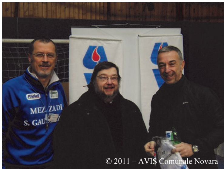
© 2011 – AVIS Comunale Novara

Considerato lo straordinario evento sportivo, sempre più sentito e affollato da atleti e collaboratori, molti sono stati gli sponsor fra i quali oltre ad Avis Novara, Igor, Barilla, Carrefour, tra i principali.